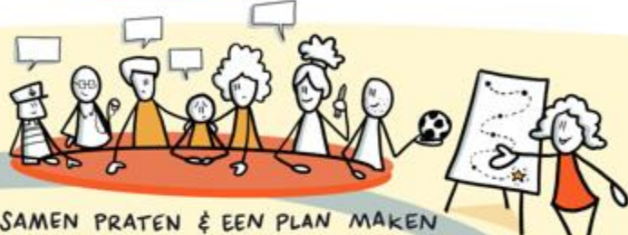
SAMEN PRATEN & EEN PLAN MAKEN